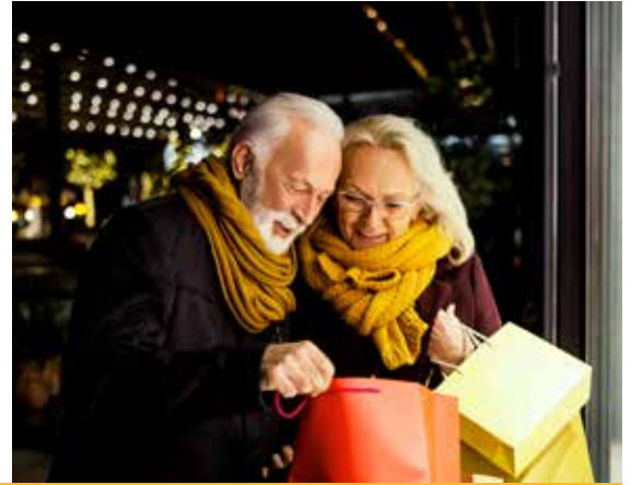
Een speciale dank-je-wel voor het Deerlijkse vrijwilligerswerk!