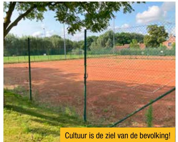
Cultuur is de ziel van de bevolking!

Met deze sterke lijst trekken wij op 13 oktober 2024 naar de kiezer: