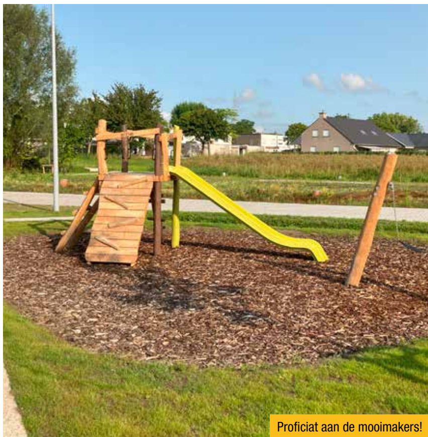
Proficiat aan de mooimakers!