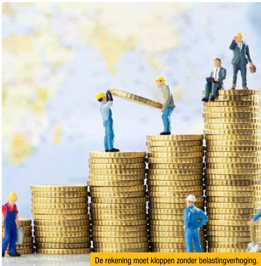
De rekening moet kloppen zonder belastingverhoging.