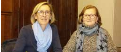
Nieuw gezicht in de OCMW-raad p. 2