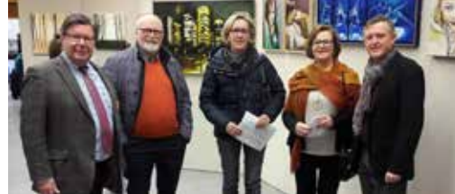
Hart voor kunst en Magenta p. 3